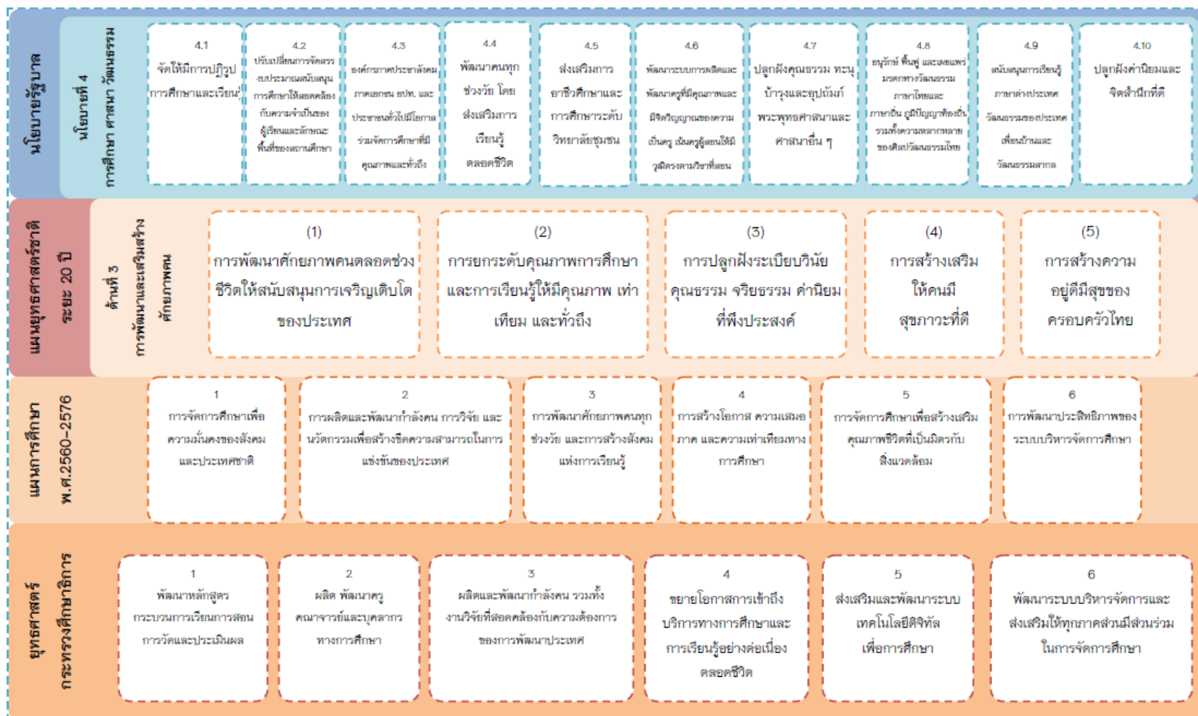
แผนภาพที่ 1 แผนความเชื่อมโยงระหว่างนโยบายรัฐบาล